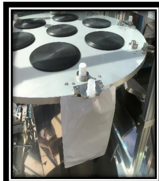
↑ 容器・キャップ 供給部