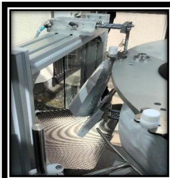
↑ 容器排出シュート部